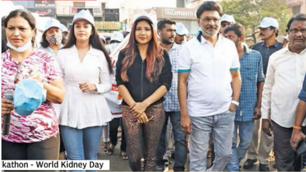
Walkathon - World Kidney Day